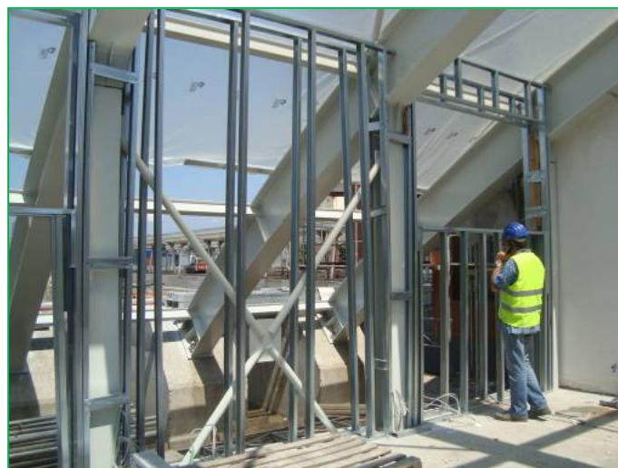
Corp A–Structura metalica pereți ghips-carton