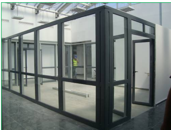
Corp B – Spațiu comercial