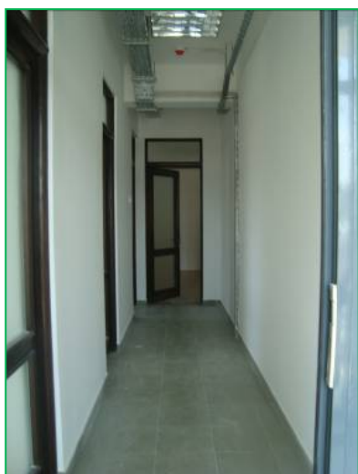
Corp A – Finisaje interioare