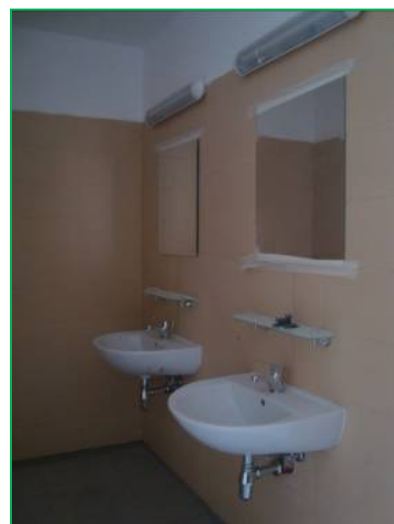
Corp A – Obiecte sanitare