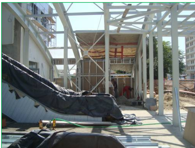
Corp A – Închideri cu gips carton