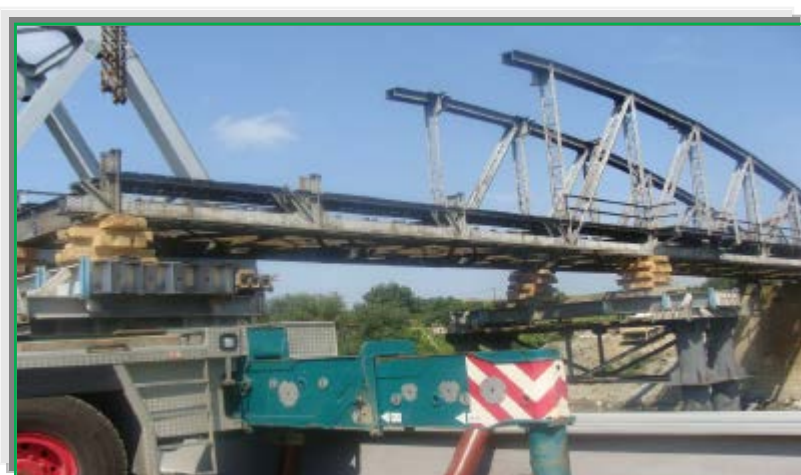
Demontare tablier vechi, mal stâng Luduș