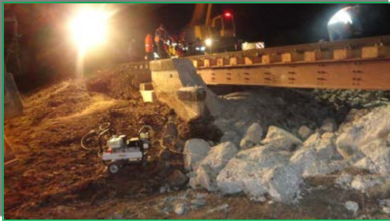
Introducere în cale pod provizoriu G13,5