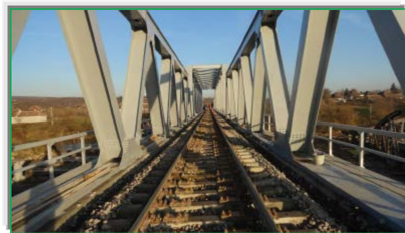
Realizare suprastructură CF pe pod