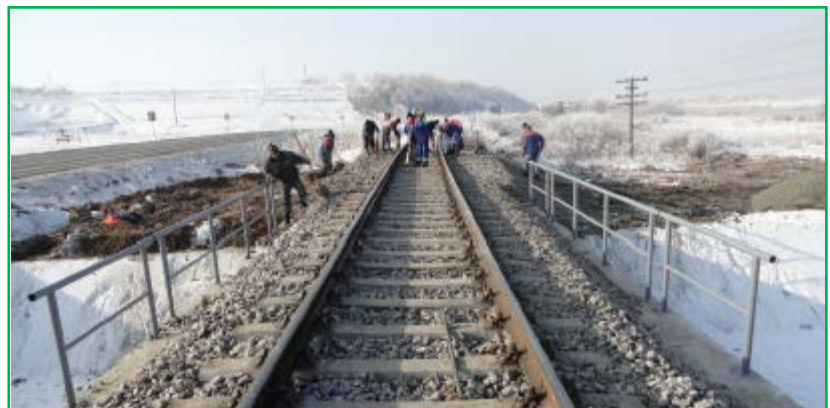
Lucrări de linii