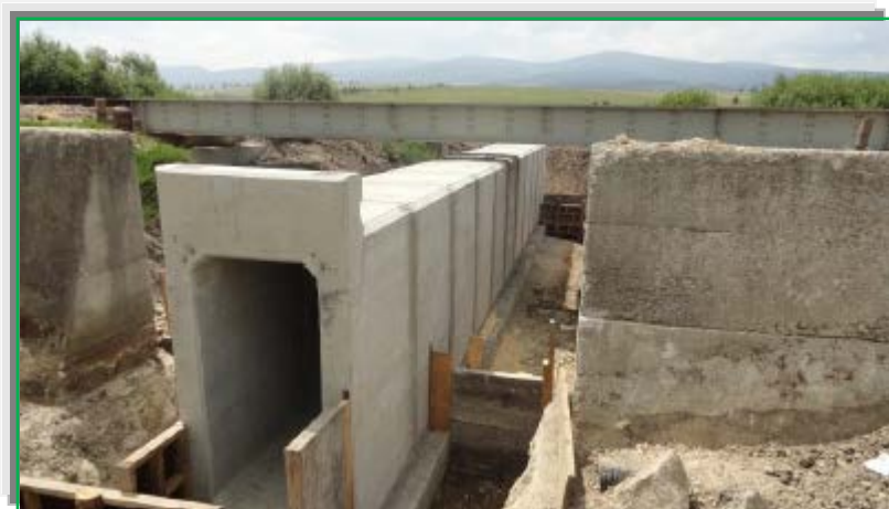
Montare cadre prefabricate tip C1EN