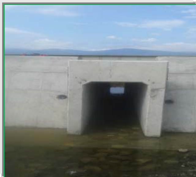
Pereu zidit din piatră brută în interior podeț