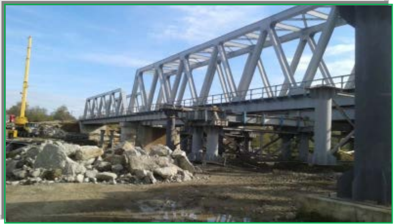
Demolare infrastructuri vechi