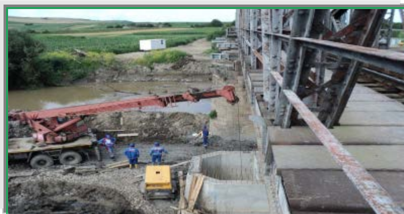
Săpătură în cheson deschis – Pila I Bogata