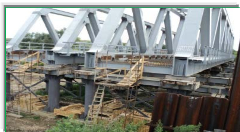
Pregătire cofraje pentru dală tablier L= 63 m