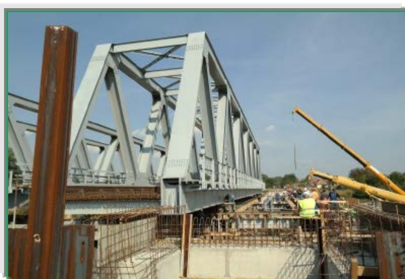
Ripare tablier nr.2, L=63 m