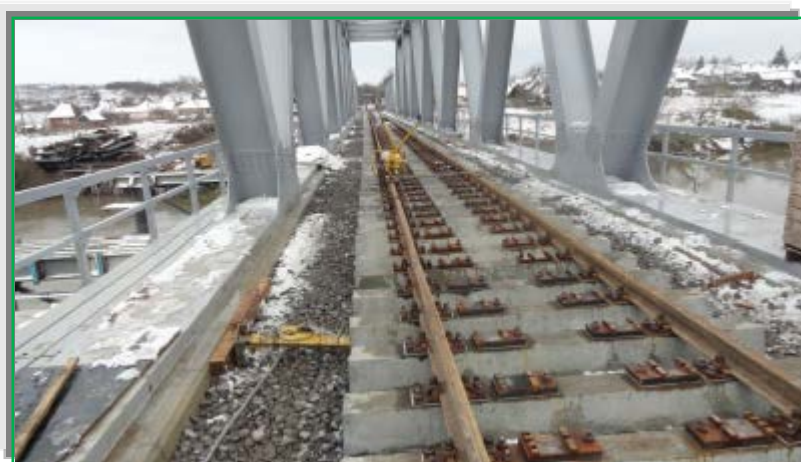
Finalizare lucrări de linii CF