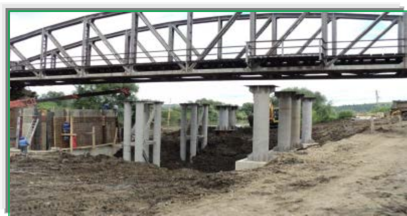
Schele ripare – lansare, mal drept Bogata