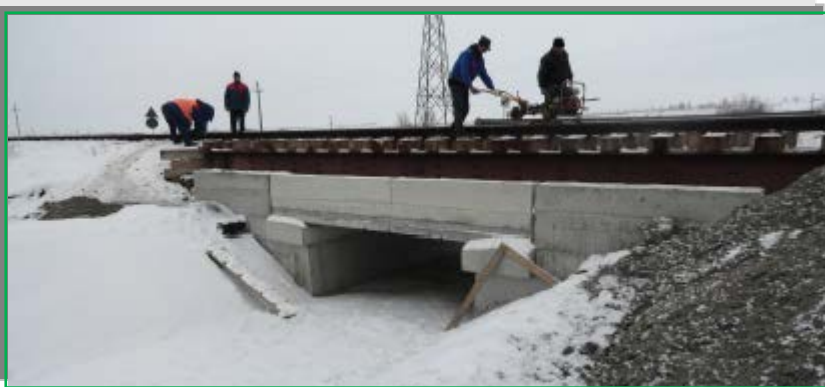
Lucrări pregătitoare scoatere din cale pod provizoriu