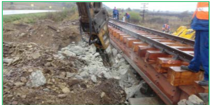
Demolare infrastructuri până la cota prevăzută în proiect