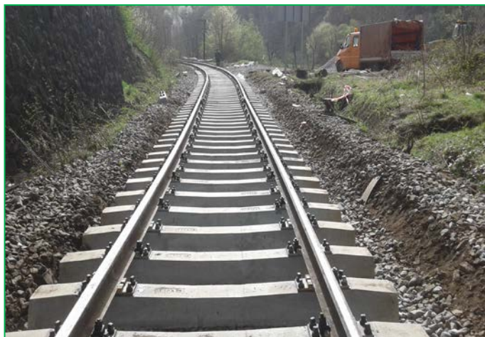
Montare cadru sina - traversa, Tunel Balnaca