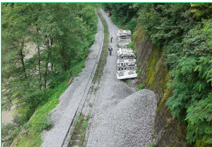
Depozitarea traverselor si a pietrei sparte, Tunel Stanca