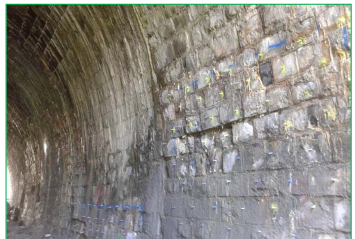
Injecții cu rășini epoxidice, Tunel Stanca