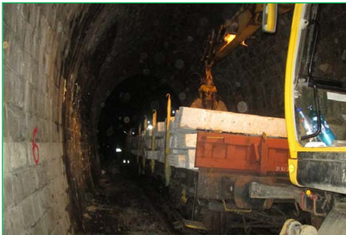
Transport traverse la locul lucrării, Tunel Stanca