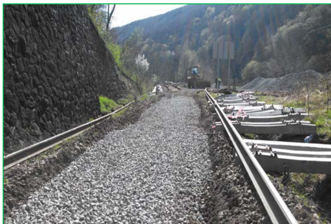
Așternere strat de piatra sparta, cap X Tunel Balnaca