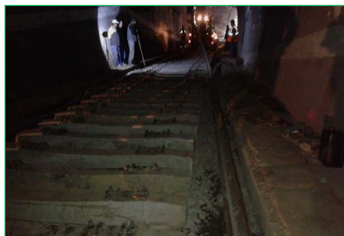
Montare sina , Tunel Balnaca