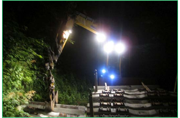
Descărcare traverse noi, Tunel Stanca