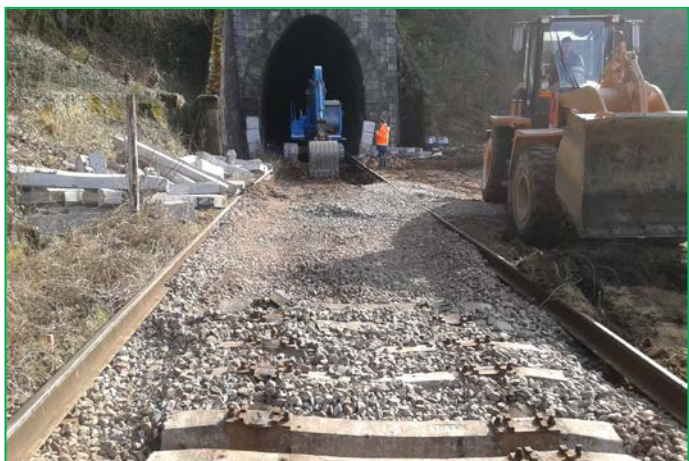
Excavații pentru execuție suprastructura noua, Tunel Balnaca