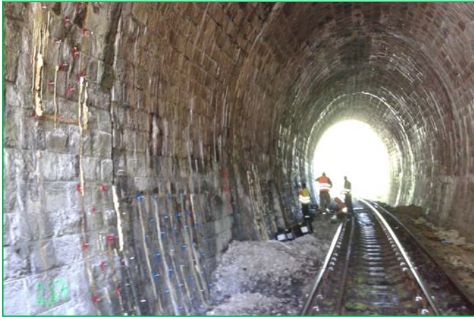
Injecții cu rasina epoxidica, Tunel Stanca