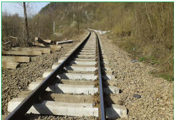
Montare șină pe traversele noi de beton, cap Y Tunel Balnaca