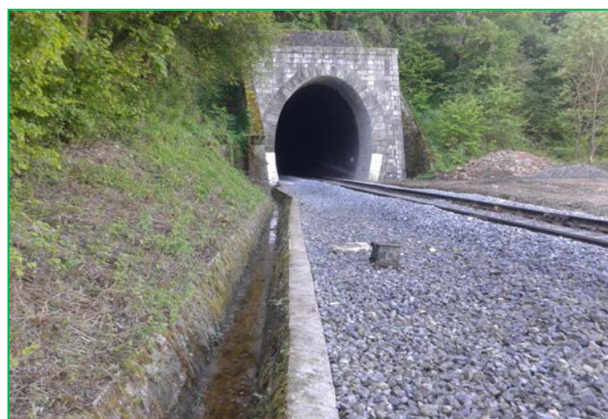
Decolmatare canal colector cap Y, Tunel Balnaca