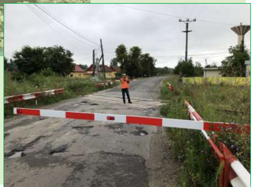
Probe de bune funcționare cu instalația de barieră automată din capătul X al stației Făget