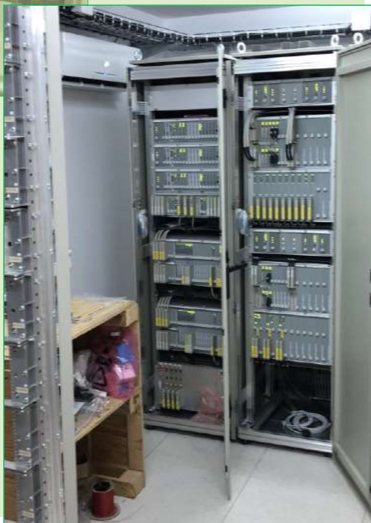
Vedere interioară a unei părți a echipamentului electronic din Stația Cliciova înainte de punerea în funcțiune