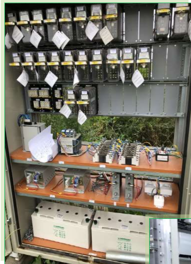
Vedere a aparatului instalației de barieră automată la trecerea la nivel din Stația Cliciova în perioada probelor de bună funcționare