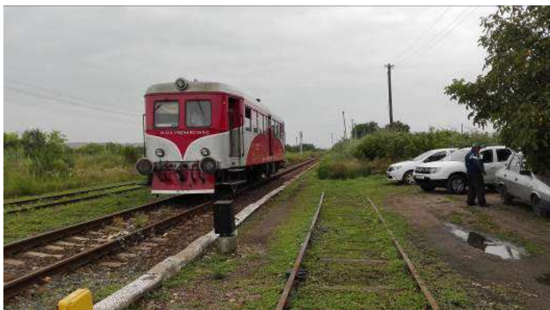
Primul tren în circulație expedit după darea în funcțiune a instalațiilor CEL de pe distanța Ilia - Lugoș