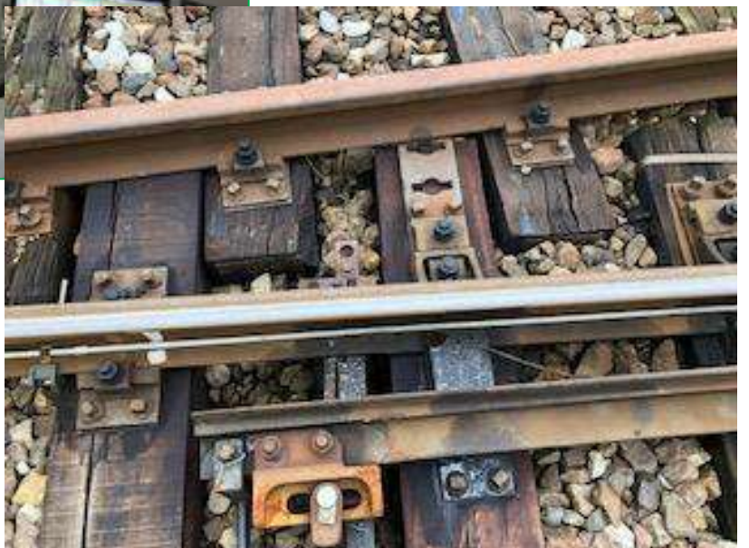
Verificarea instalației de topire a gheții și zăpezii Stația Mănăștur