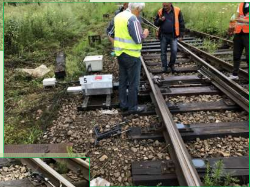
Probe de bună funcționalitate a schimbătorului Nr. 5 Stația Făget și a electromecanismului de macaz