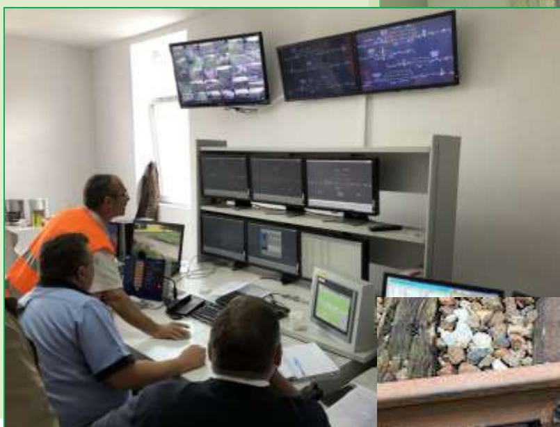
Vedere a postului central al operatorului de trafic din stația Făget în timpul probelor tehnice cu instalația coreCEL