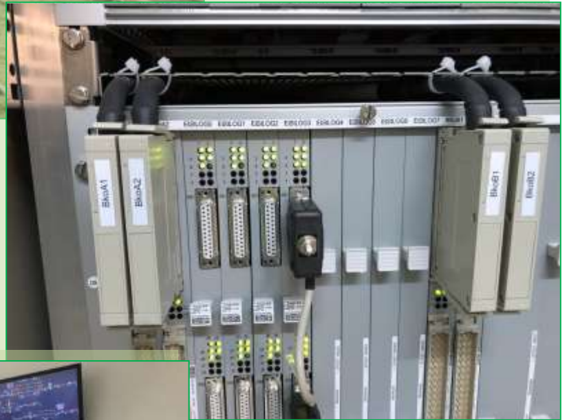
Vedere interioară a unei părți a echipamentului electronic din stația Margina înainte de punerea în funcțiune