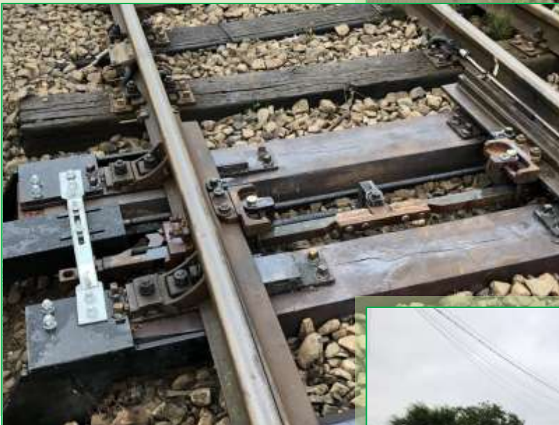
Darea in funcțiune a electromecanismului de macaz nr. 7 din Stația Făget