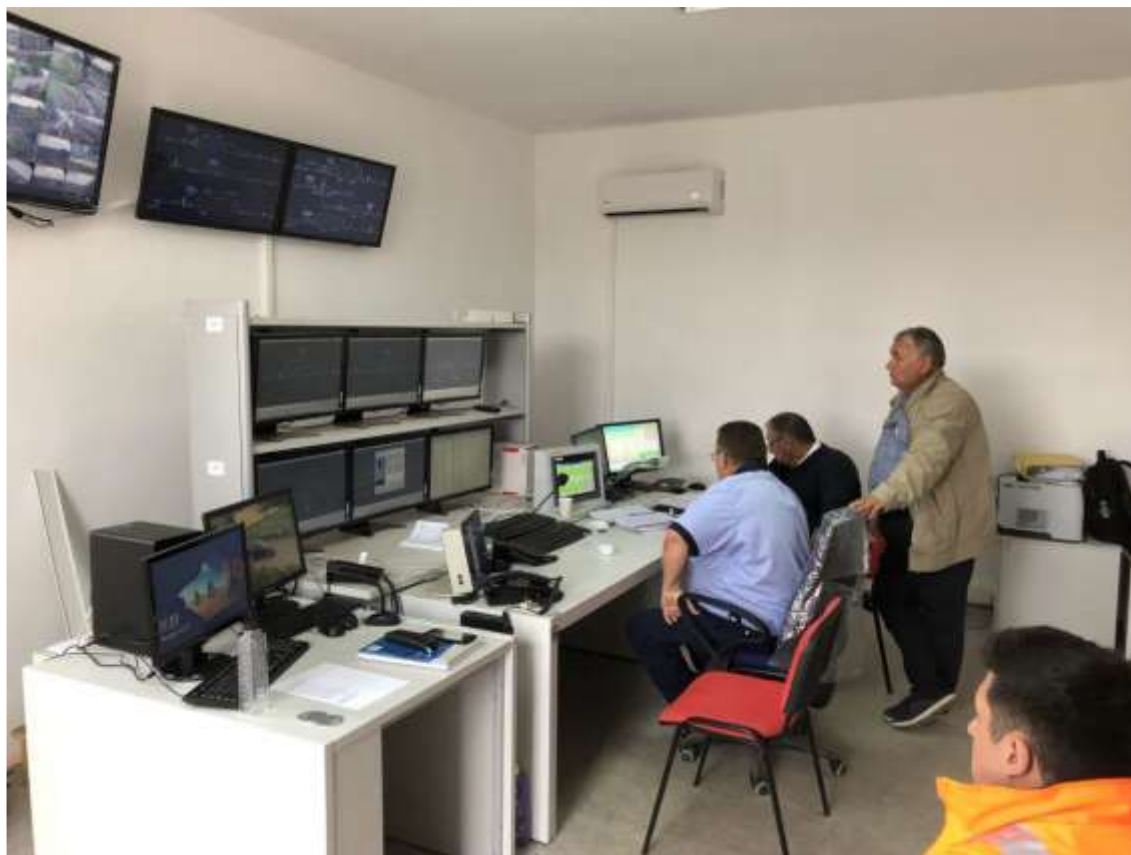
Vedere a postului central al operatorului de trafic din stația Făget în timpul probelor tehnice cu instalația CEL (centralizare electronică de linie)