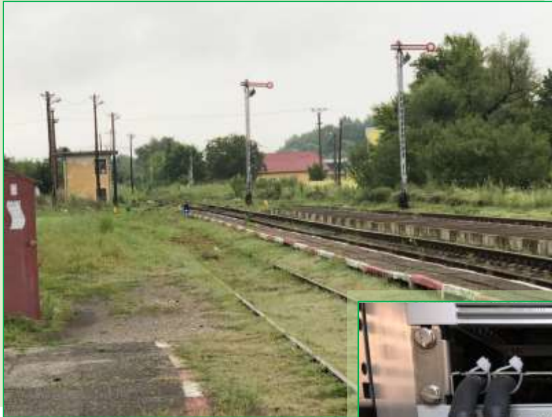
Vedere asupra unei cutii de conexiuni pentru numărătorul de osii