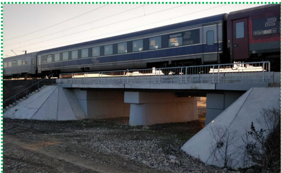
Pod km 21+888 linia de cale ferată BUCUREȘTI - VIDELE