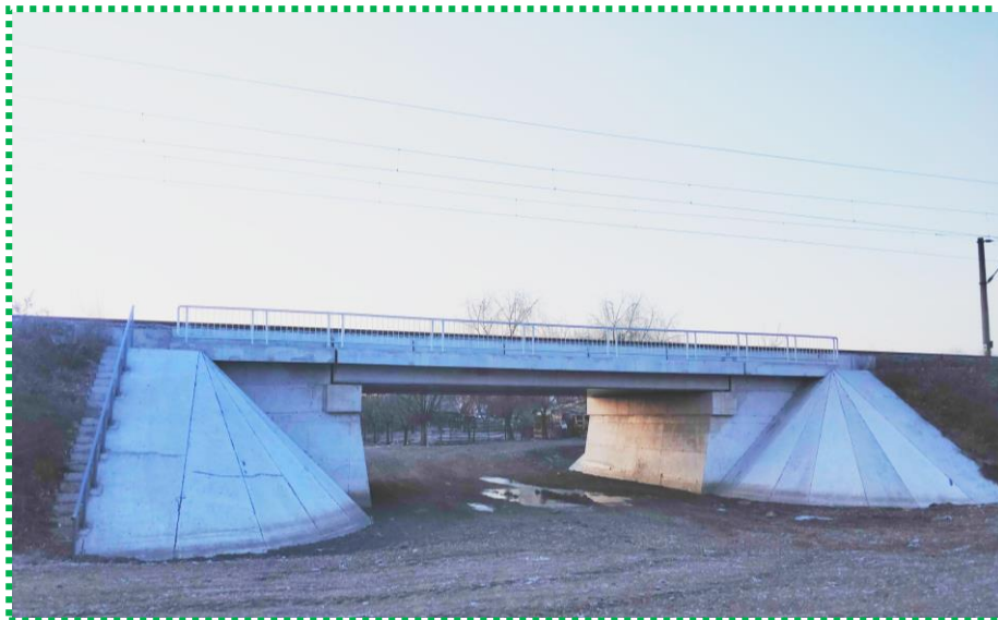
Pod km 21+084 linia de cale ferată BUCUREȘTI - VIDELE