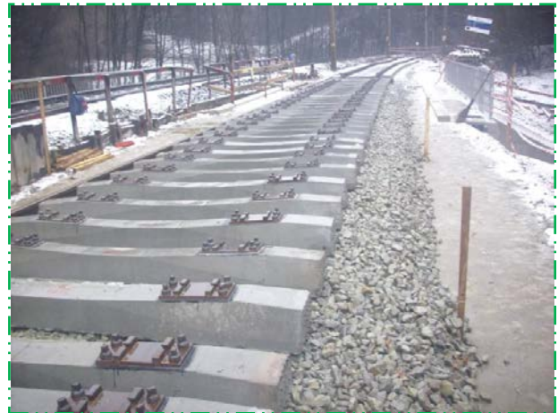
Lucrări de linii cf