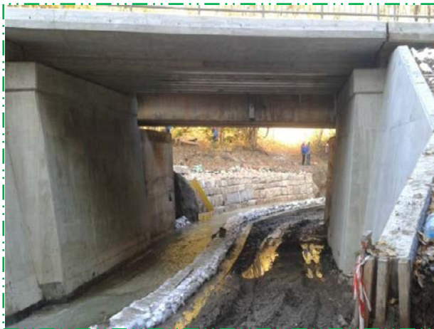
Deviere curs apă pentru realizarea pereului de fund