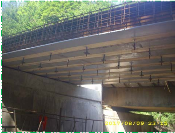
Montare armătură în tablier