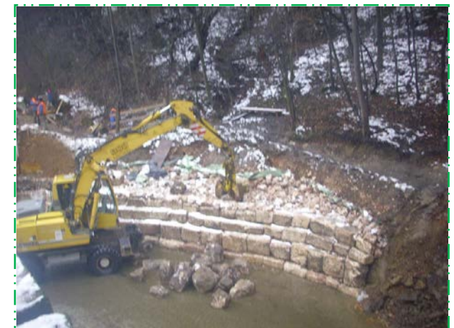
Completare cu anrocamente pentru protecție mal stâng