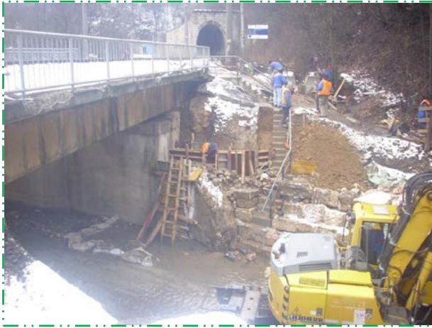
Balustradă la scări acces aval culee Simeria