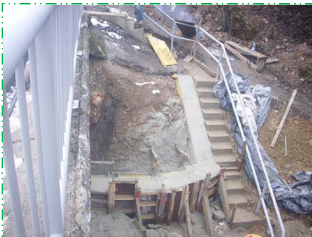
Fundație sfert de con culee Simeria aval