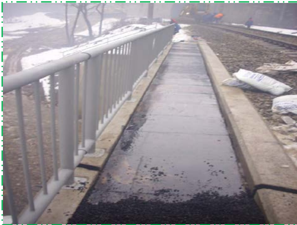
Trotuar din asfalt turnat la rece