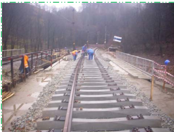
Refacere suprastructură linie cf