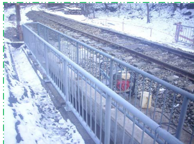
Montat parapeți interiori de protecție pe ambele fire