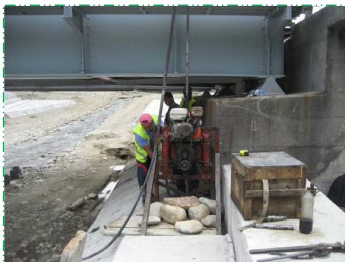
Teste tip PENETRARE DINAMICĂ UȘOARĂ (PDU) pentru verificarea calității lucrărilor de îmbunătățire a capacității portante a terenului de fundare fir I