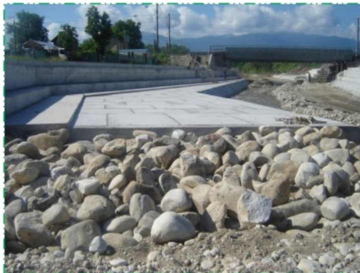
Realizare saltea piatră brută aval