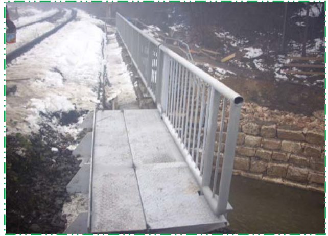
Parapet, consola trotuar și opritori de balast