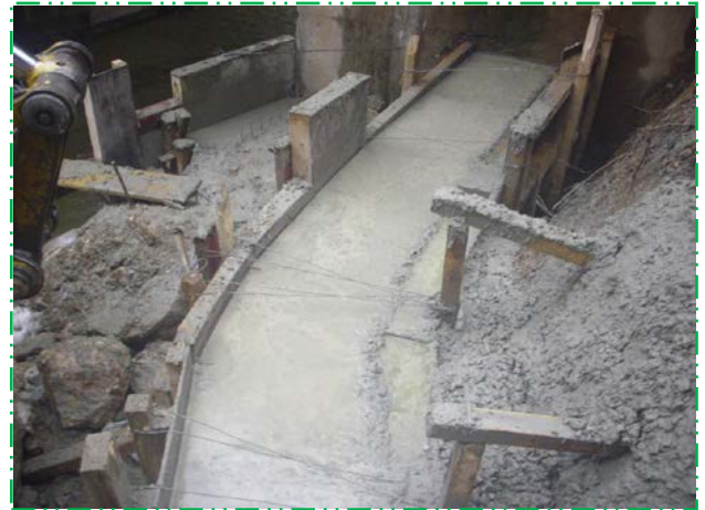
Turnat beton în fundație sfert de con culee Simeria aval