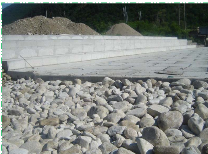
Executat saltea din piatră brută amonte