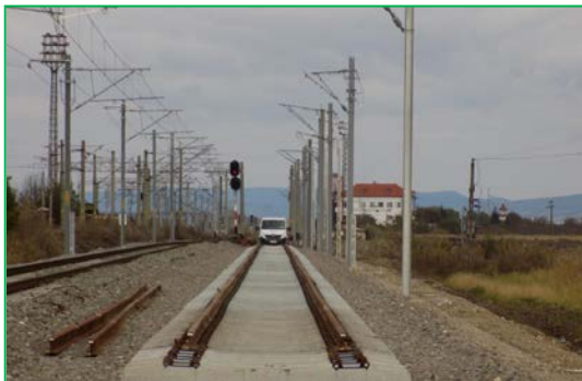
Km 404+100ex. Fir 2 – montare suprastructură