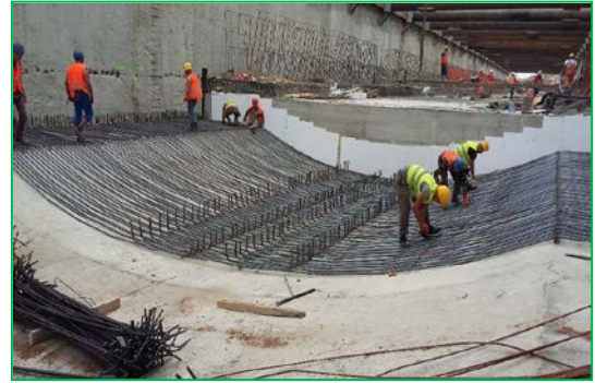
Km 456+640.37 - km 456+690.17 - radier boltă întoarsă