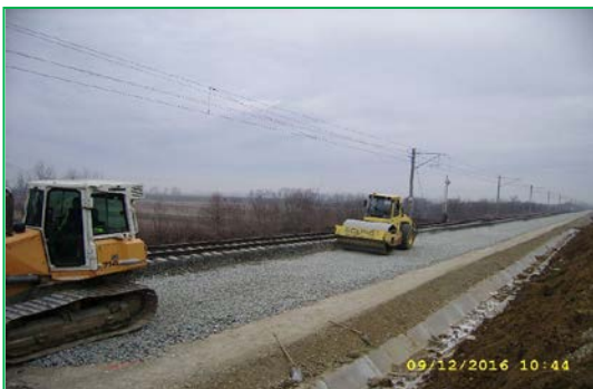
km 458+670 - km 459+170 - Execuție strat de piatră spartă