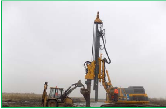
Km 397+500pr. - Execuția coloanelor din material granular