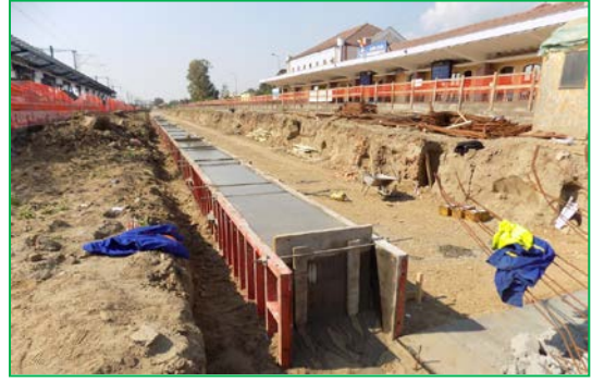
Stația Alba Iulia Km 412+350pr. – fundație peron