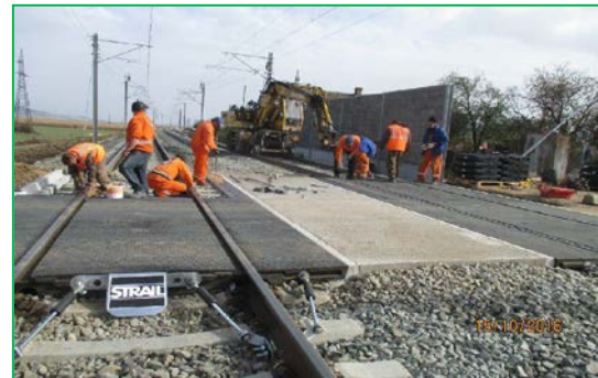
Stația Blandiana - trecerea la nivel CF km 426+888