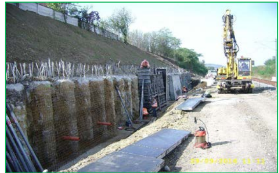
km 458+870 - 458+918 - Execuție zid mască