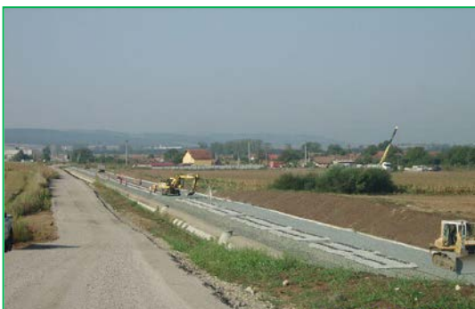
Km 450+637-452+400 fir I+II - Execuție suprastructură