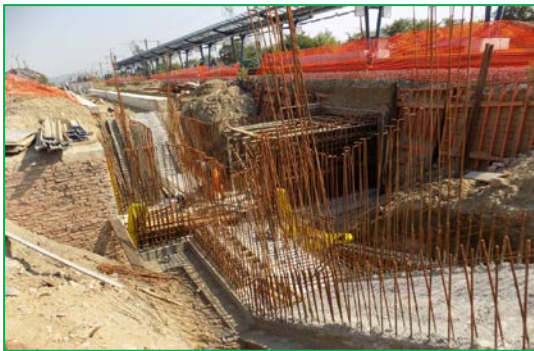
Stația Alba Iulia Km 412+350pr. – Execuție fundație tunel pietonal