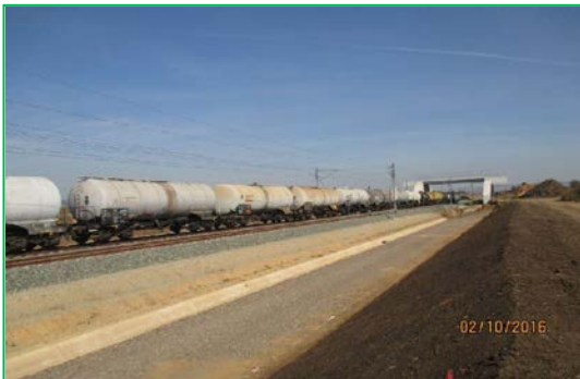
Interval Vințu de Jos - Blandiana, Km 425 + 382