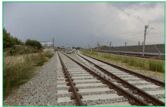
Stația Sântimbru km 402+550pr.Liniile siloz și tragere siloz