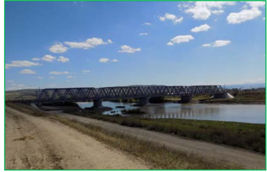
Pod Mureș km 414+641pr. – Desființare platforme de lucru în albie