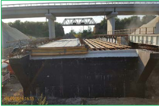
Pod km 463+121