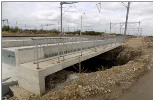
Pod km 396+834pr. – Montare parapet