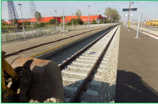
Km 407+920 pr. Linia 1 – montare și sudură suprastructură