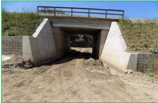
Podetș km 415+725pr. – Săpătură amenajare albie