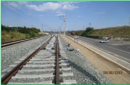
Vințu de Jos - Schimbător 106