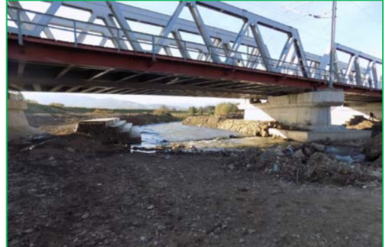
Pod Ampoi km 409+395pr. – amenajare albie