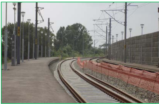
Km 401+250pr.Fir 2 – Execuție buraj 1 și sudură suprastructură