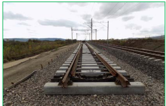
Km 399+150pr. Fir 2 – montare schimbător