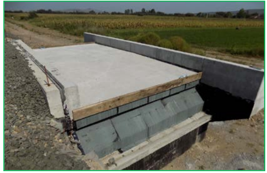
Poduț km 400+439pr. – Execuție hidroizolație și beton de protecție