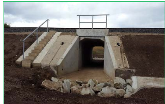
Km 441+847,04 - Amenajare canal