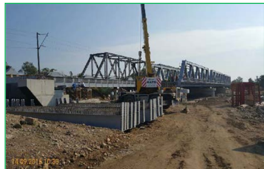
Pod peste râul Ștrei km pr. 462+841