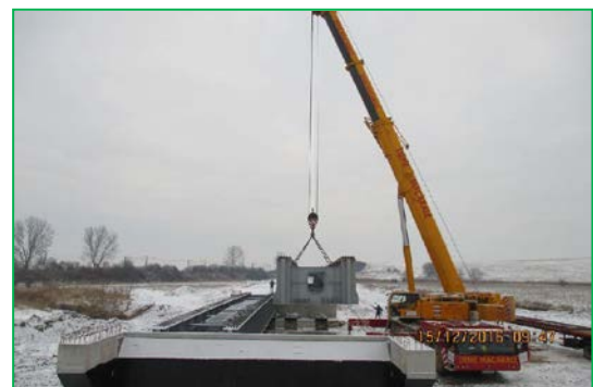
Pod km 454+718 - Montarea celei de-a doua grinzi