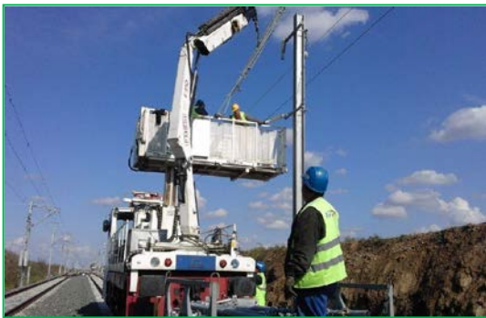
Stația Blandiana, km 426+611 – 428+971 - Instalare console