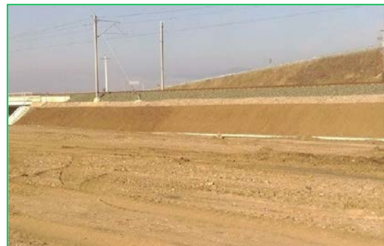
Interval Aurel Vlaicu - Orăștie – taluzare pământ