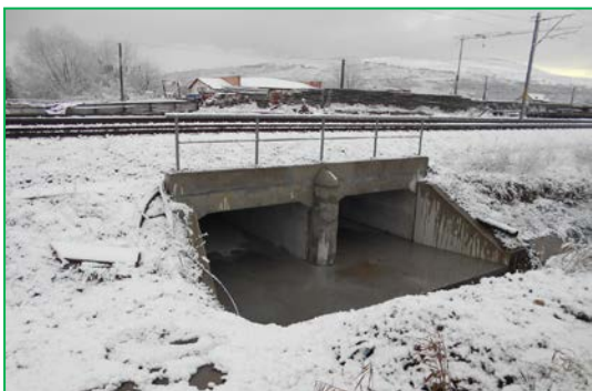
Pod km 407+005pr. – amenajare albie aval