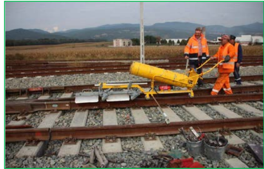
Stația Blandiana - Lucrări de sudură a liniilor CF