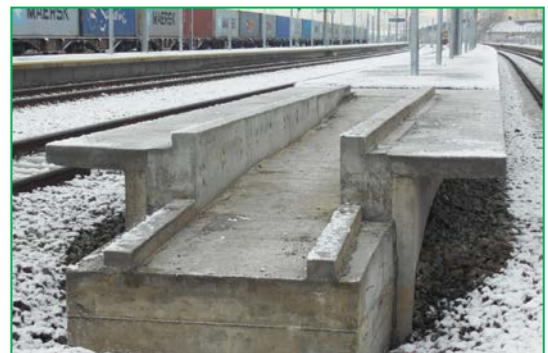
Stația Bărbant - km 407+500pr. – realizare rampă acces peron