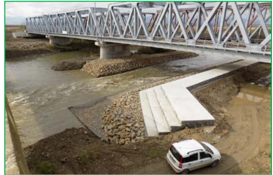
Pod Mureș Km 395+200pr. – Deviere curs Mureș