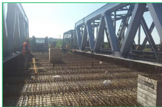
Pasaj km. 455 - Armare suprastructură