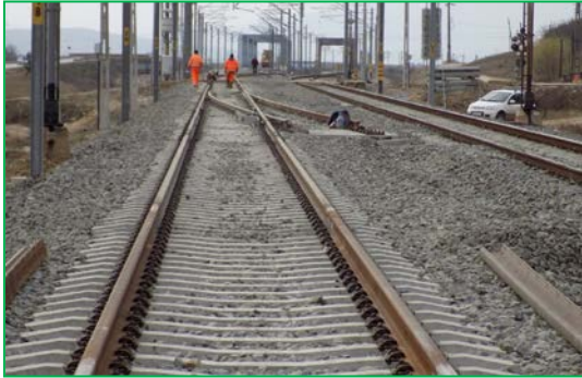
Km 394+375 ex. Sudură suprastructură și schimbători