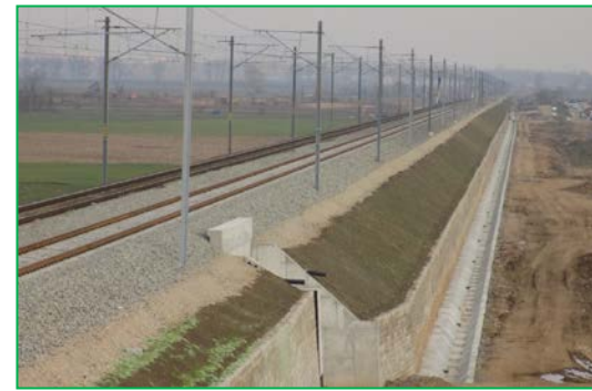
Km 418+000pr. Fir 2 – Execuție rigolă