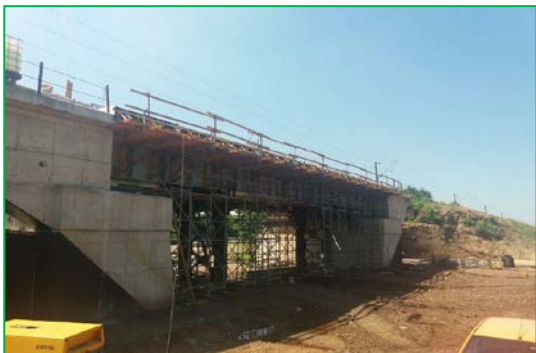
Pod km. 431+974,62