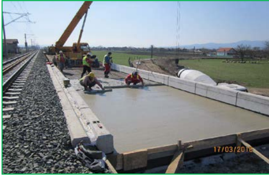
Pod km 442+085