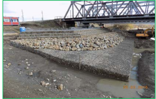
Pod Mureș km 395+200 pr. – Protecție albie, montare gabioane