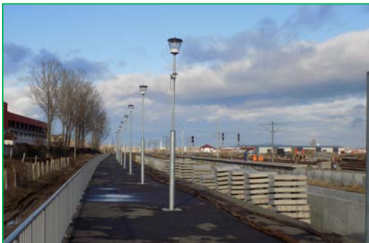
Km 407+800 pr. Stația Bărbant – Realizare peron principal