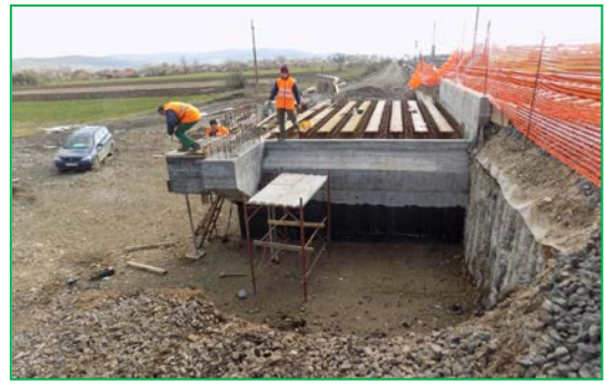
Km 400+439 pr. Execuție podeț și tablier