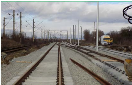
Stația Coșlariu Km 402+825 ex. Montare suprastructură și schimbători