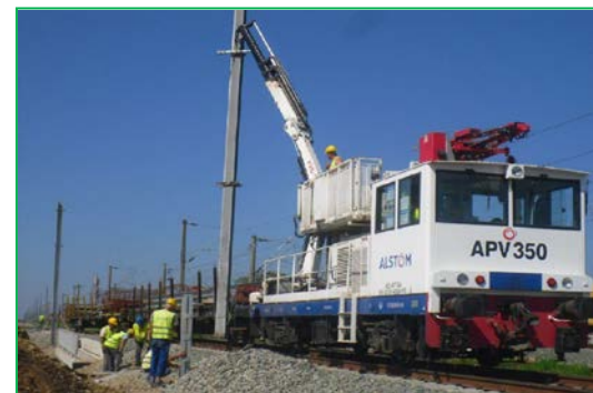
Instalare stâlpi Stația Vințu de Jos