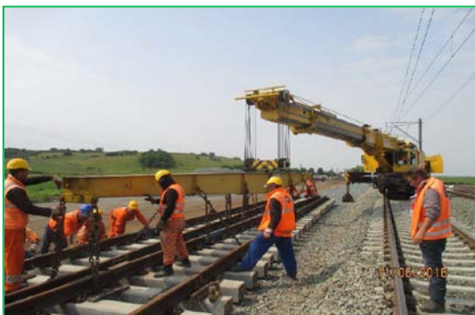
Blandiana, montare schimbător de cale cu inimă mobilă