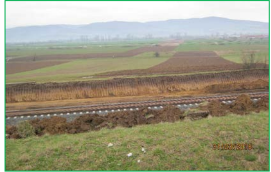
Km 452+700 – km 454+0454 fir I - Excavație