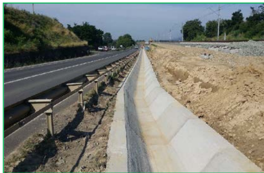
Km 423+024,58 – Km 423+217,18 – Șanț monolit