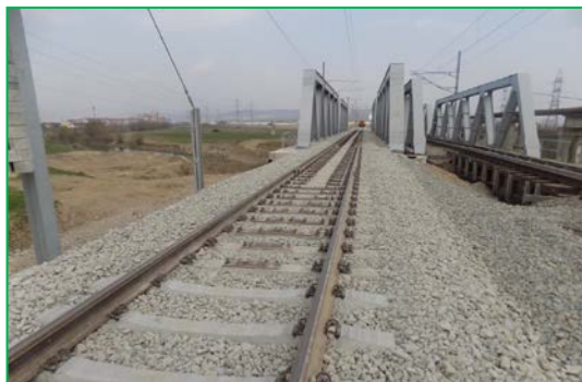
Pod Ampoi km 409+395 pr. – Montare suprastructură pe pod