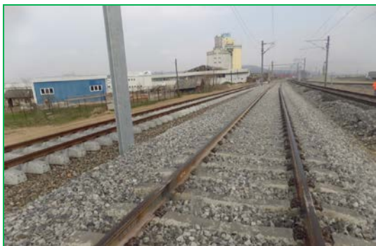
Km 408+550 pr. Fir I – Execuție buraj 2 și sudură electrică șine