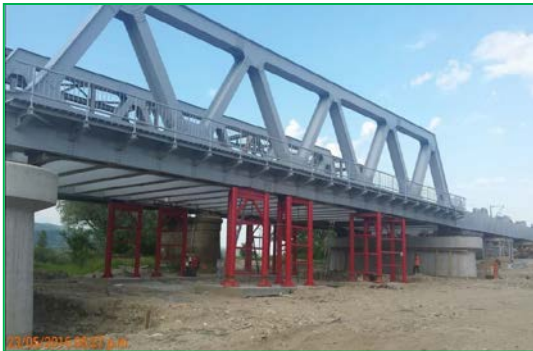
Pod peste râul Ștrei km. pr. 462+841