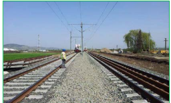
Stația Vințu de Jos