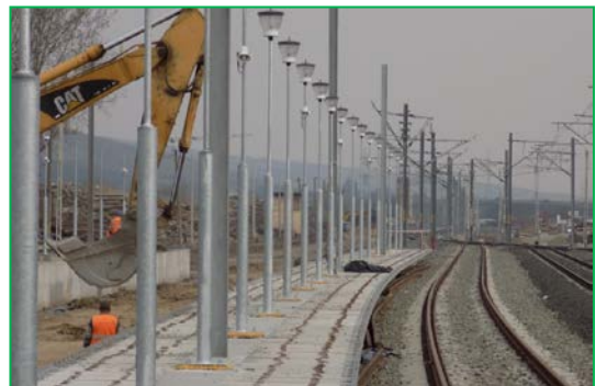
Km 407+800pr. Stația Bărbant – Realizare peron liniile 3 - 4