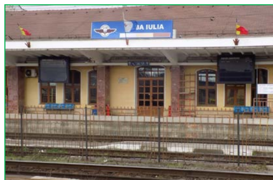
Stația Alba Iulia - Montare panouri informare călători