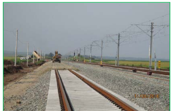
Blandiana, lucrări de balastare, km 427+800 – km 428+000