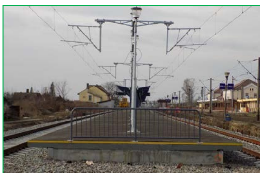
Km 412+150 pr. Peron liniile 4-5 – Montare balustradă