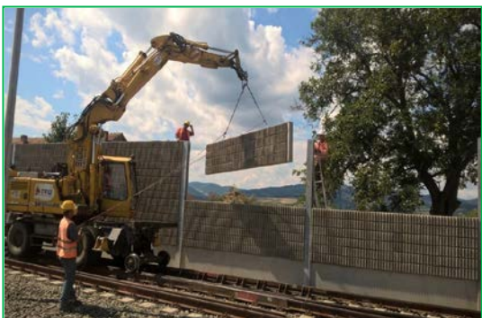
Montaj panouri fonoabsorbante Km. 421+800 – 421+880