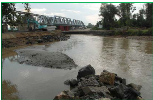
Pod peste râul Ștrei km pr. 462+841 - Tablier metalic