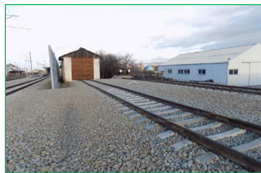
Km 412+600pr. Linia Remiză – Montare suprastructură