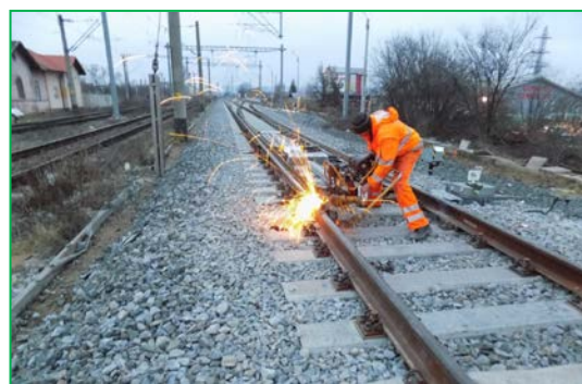
Km 412+850pr. Liniile 4-5 – Execuție buraj 2 și sudură alumino-termică