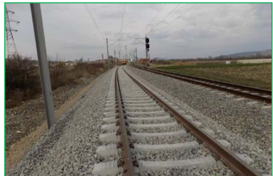
Km 404+000pr. Fir 1 – Execuție primul buraj și sudură șină